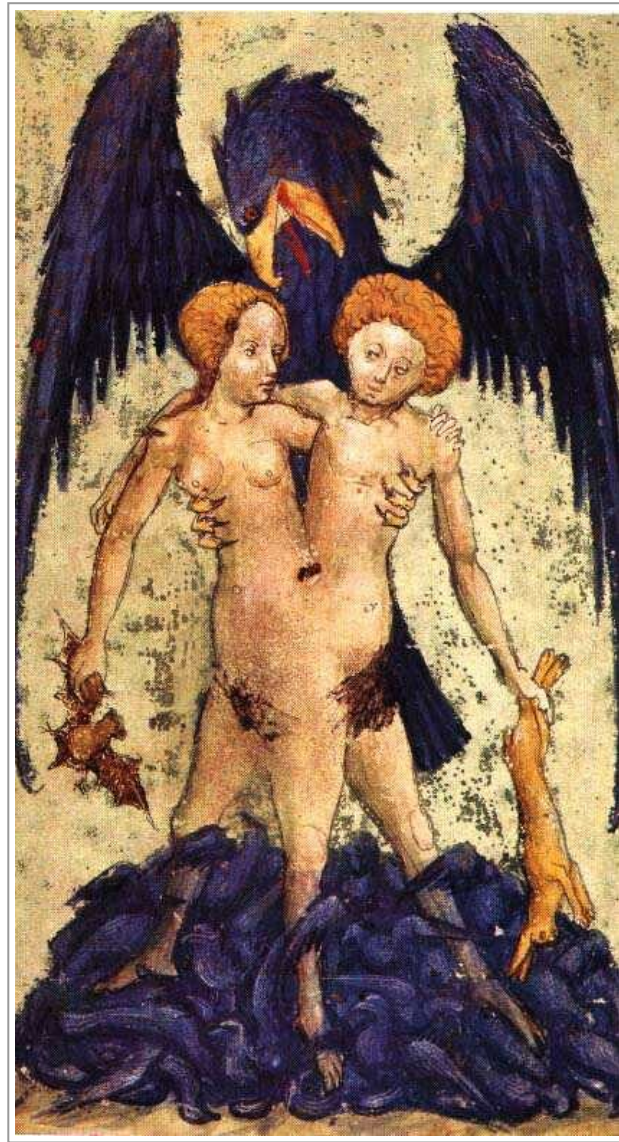
Simbolo del mercurio igneo, maschile-femminile

Se l'attivarsi del pensiero simbolico consentisse al soggetto di mettere in congiunzione gli opposti, il dentro con il fuori, il concreto con l'astratto, la gabbia dorata della malattia, l' autoinganno , potrebbe venir scovata e l'identità dello stesso (il soggetto DCA si identifica inconsciamente con la malattia) ne sarebbe minacciata.