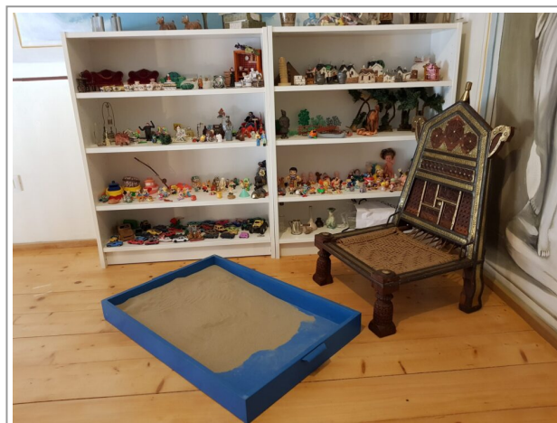
Foto sabbiera per Sand Play Therapy

La psicoterapia junghiana annovera tra le possibilità di intervento: interpretazione dei sogni, psicodramma, immaginazione attiva, anche il gioco. Nello specifico si avvale della Sand Play Therapy , o Gioco della Sabbia , o Sand Play Analysis come ho sentito chiamarla durante la seconda lezione relativa Master DCA che sto frequentando a Livorno promosso dall' AIRP .