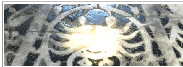
Il segno del Cancro, dettaglio dello zodiaco di San Miniato al Monte

All'interno della basilica, sul pavimento è scolpito un meraviglioso zodiaco che fino a poco tempo fa si pensava fosse esclusivamente di decorazione. Invece uno gnomonista (costruttore di meridiane), tale Simone Bartolini, in epoca recente ha scoperto che proprio durante il solstizio d'estate (dal 20 al 22 giugno), e pochi minuti dopo mezzogiorno, un raggio di luce illumina il segno del Cancro associato a sua volta con la notte di San Giovanni Battista (24 giugno, patrono di Firenze).