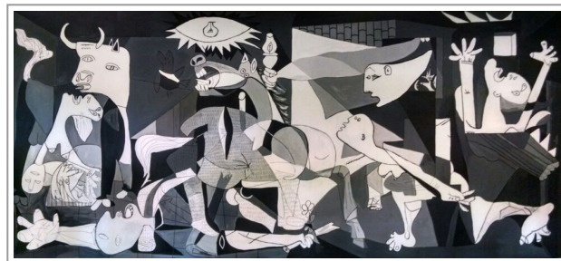
Bombardamento di Guernica, Picasso 1937

La prima modalità è il pensiero artistico, lavorare con i resti , lavorando con la ferita, non cancellando la ferita, mostrando la ferita, trattando la ferita, come fanno i grandi artisti.