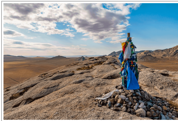
Ovoo Mongolia

Esistono poi altre forme di scultura simili all'Ometto di Pietra, presso altre culture: