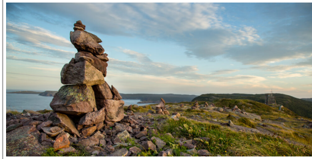
Inuksuit – ph blog.culturalelements.com

Incontrare la stessa modalità di espressione scultorea in due luoghi così lontani tra loro ha smosso in me il desiderio di saperne di più, così cercando in rete ho scoperto che questa forma di scultura, in Italia, si chiama Ometto di Pietra e viene utilizzata dagli alpinisti per segnalare i sentieri di montagna , per essere di aiuto a chi verrà dopo.