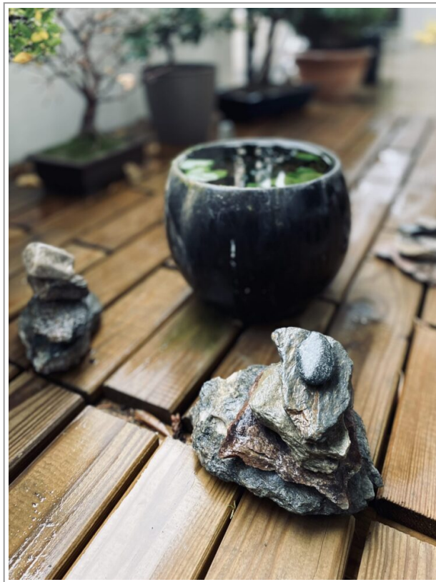
Mini Cairn con sassi delle Dolomiti a casa mia

Altri Cairn sono stati poi rinvenuti anche in Somalia, Asia e nelle Americhe. Persino gli Stupa Tibetani si pensano siano derivati dai Cairn.