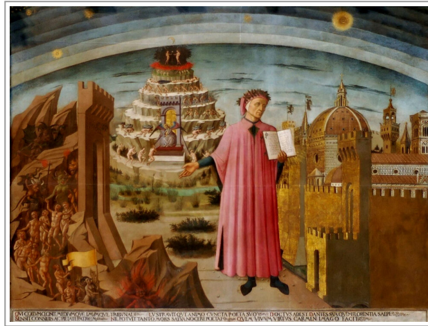
Dante e il suo poema, affresco di Domenico di Michelino nella Cattedrale di Santa Maria del Fiore, Firenze (1465)