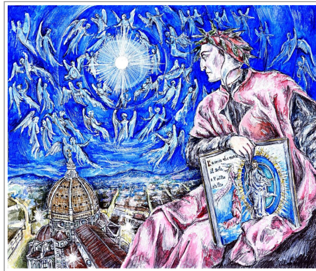
Dante contempla l'Empireo

Il compimento del processo di individuazione restituisce l'essere umano alla sua vera e unica natura che si opera attraverso la ricongiunzione con il femminile (Beatrice per Dante).