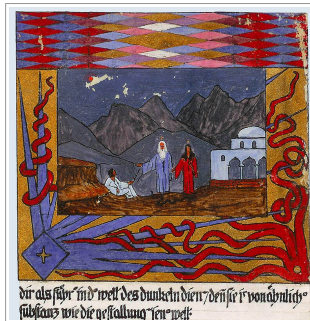
Elia e Salome? (Libro Rosso, Jung)

Elia e Salomè che Jung incontra in uno stato meditativo (immaginazione attiva) mentre scrive il Libro Rosso, rappresentano il logos e il sentimento che andranno poi ad integrarsi nella sintesi degli opposti.