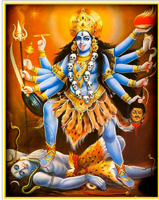
La dea Kalì danza sul corpo del dio Shiva. Il dio immerso nello stato contemplativo, la dea danzando al di sopra del dio risveglia e rende manifeste e operative le sue valenze altrimenti inaccessibili

Sempre in ambito indù, Il femminile è ritenuto messaggero o porta verso i mondi celesti, ciò che pone a contatto con il divino e dona il potere trasformativo.