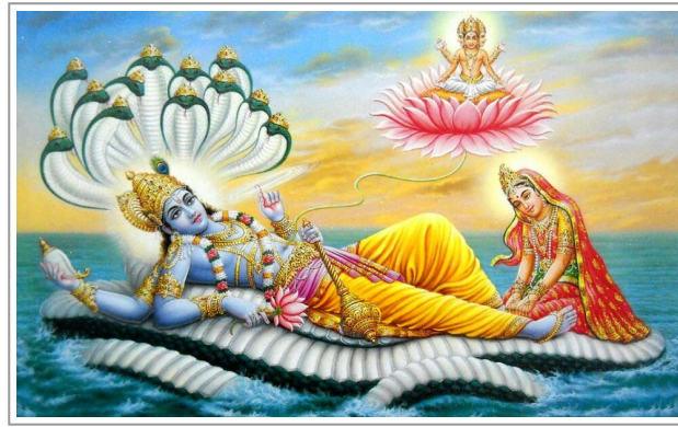
Visnu Na?ra?yan?a, in contemplazione, costruttore di mondi