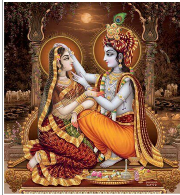
Shiva Shakti, maschile e femminile

simboli che derivano dalla tradizione del tantrismo indù (IV d.C.). La polarità femminile per la cultura induista è chiamata Shakti che costituisce il potere attivo della divinità maschile : Shiva .