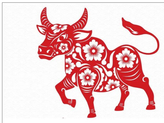
Losar 2021: anno del bue di ferro

Oggi 12 febbraio 2021 si festeggia il Losar , il nuovo anno Tibetano, in Tibet è il più grande evento dell'anno, celebrato con antichi cerimoniali che ricordano la lotta tra il bene e il male.