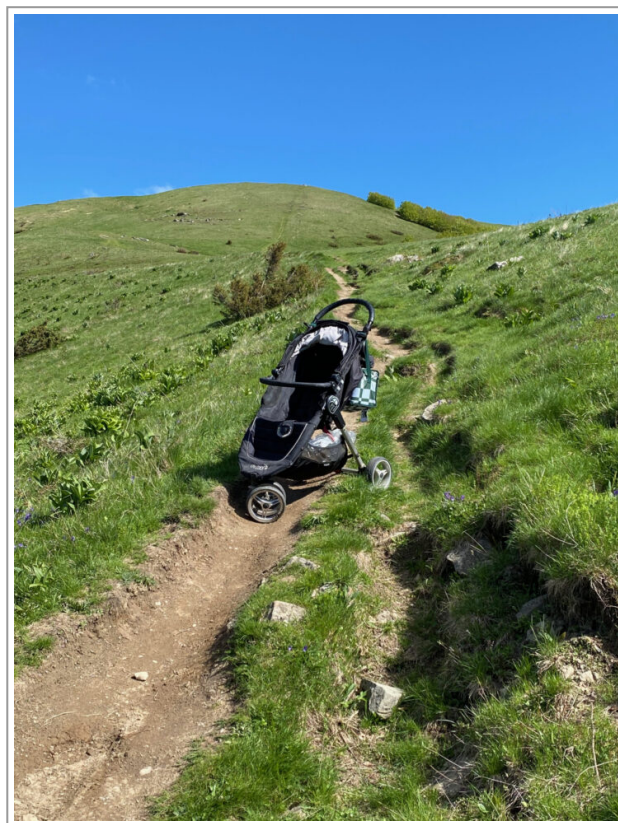
Con il passeggino fino alla cima

In alto i prati sono di un verde intenso, ci sono delle specie di fiori bellissimi e colorati, l'avventura con il passeggino è abbastanza ardua, sul crinale abbiamo trovato un vento fortissimo, ma ne è veramente valsa la pena.