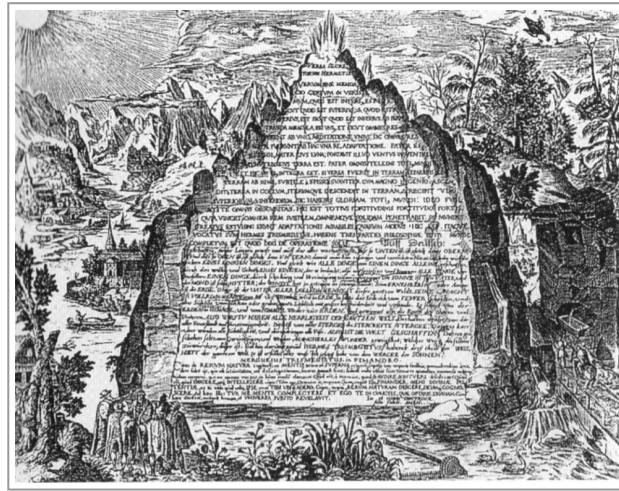
La tavola di smeraldo o smeraldina

Passa per di qua, tra mente e corpo, la via della cura verso il recupero degli opposti, scissi e in lotta tra loro.