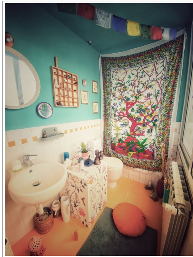
Il mio gompa domestico

Quando comprammo questa casa era qui presente un secondo bagno, piccolo, microscopico, situato su una piccola veranda nel retro del palazzo.