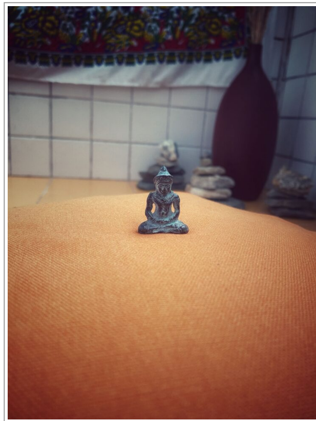
Piccolo Buddha o Purusa (uomo)

Ho poi ricominciato a meditare nel 2020 quando ho sentito in me maturare qualcosa che mi avvicinava alla pratica in modo più saggio e meno infantile. Nel 2016 meditare per me significava “fuggire dalla realtà”, dal 2020 ha assunto il significato di “restare, sostare, permanere, nella realtà”. Ricordo ancora perfettamente quando ho ricominciato, era il mese di giugno, il mio analista mi aveva appena annunciato di un imminente corso di “ immaginazione attiva ” con uno psicologo analista junghiano. L’immaginazione attiva è una pratica che può ricordare la meditazione, così in quella notizia colsi l’invito a tornare a posare lo sguardo dentro di me, non solo attraverso i sogni, ma anche con la meditazione; il corso sull’immaginazione attiva non fu fatto per via del COVID, ma ormai in me il sentiero si era di nuovo aperto.