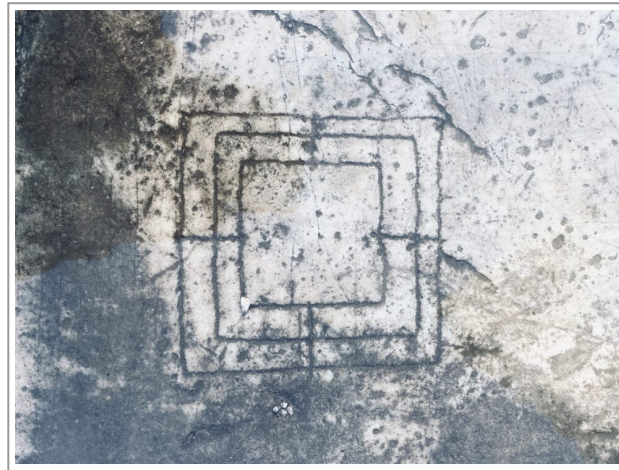
Gioco del filetto nella pietra della Rocca di San Silvestro – Val di Cornia

Passeggiare all'interno di antiche e bianche rovine che si ergono maestose su questa valle è un viaggio nel tempo , la pietra è sempre quella stessa pietra che ha visto scorrere la vita dei minatori e della loro famiglie.